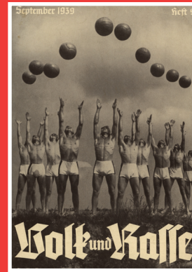
GLEICHGESCHALTETE ÄSTHETIK #Volksaufklärung #Deutschein