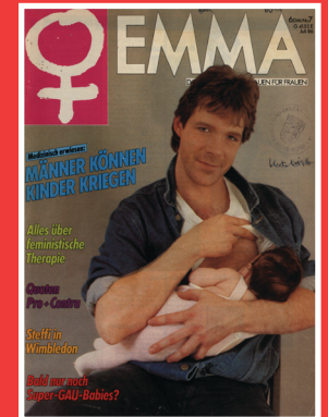
ROLLENBILDER #Frau #Mann #Gesellschaft