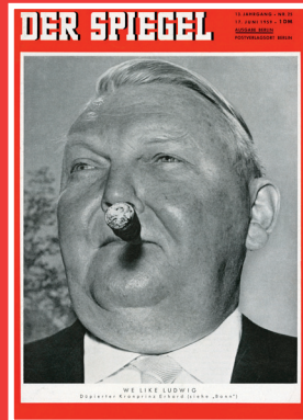
Wunder! #Nachkriegszeit #Aufschwung