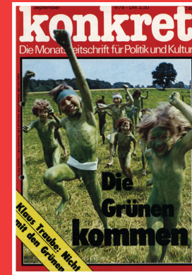
UMWELT BEWEGT #Klima #Ökos #Protest