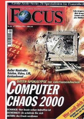
MILLENNIUM #Digitalisierung #Y2K #2000