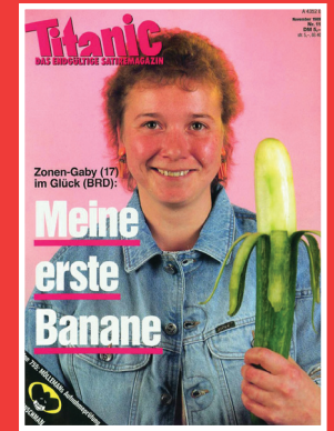
JETZT WÄCHST ZUSAMMEN... #Einheit #Deutscher Michel