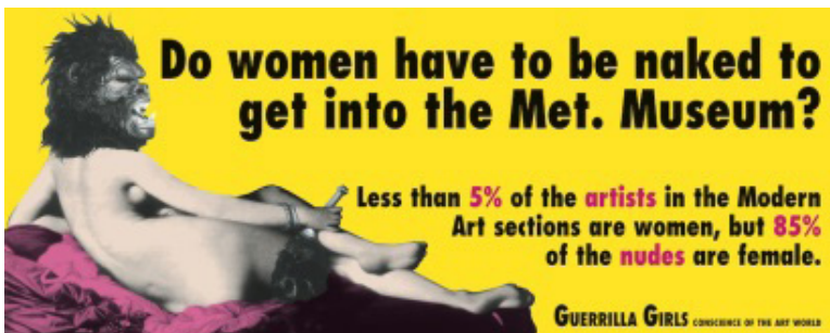
Abb. 8: Plakat der Guerrilla Girls. 2

Die US-amerikanische Aktivist_innengruppe Guerilla Girls hat die Frage nach der Repräsentation von Frauen in Museen für das Metropolitan Museum in New York unterhaltsamer formuliert: