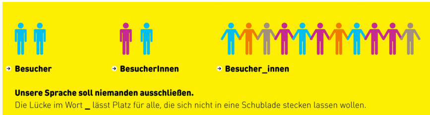
Abb. 4: Vielfarbige Strichmännchen veranschaulichen einen Sprachgebrauch, der Vielfalten in mehrerer Hinsicht zulassen will.

Strichmännchenfiguren können aber auch eine Geschlechtervielfalt symbolisieren, wie z.B. in der Abbildung eines Ausstellungsbegleitheftes: