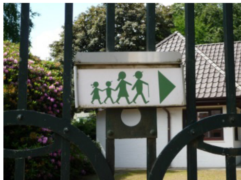
Abb. 3: Wegweiser, auf dem die bürgerliche Kleinfamilie die Besucher_innen repräsentiert.

repräsentierte die Besucher_innen des Tierparks und spricht dabei nur Angehörige der bürgerlichen Geschlechterordnung an (Abb. 3). Dieser Wegweiser stammt aus den 1950er Jahren und wurde als unzeitgemäß eingestuft und durch einen neuen, geschlechtsneutralen Wegweiser ohne Figurenabbildungen ersetzt.