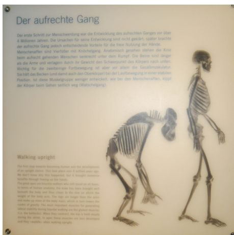
Abb. 1: Geschlechtsneutrale Figur?

Auch Abbildungen, die nicht als Ausstellungsobjekt eingesetzt werden, können zum Geschlechterwissen beitragen. Zum Beispiel zeigt der historische Wegweiser im Hamburger Tierpark Hagenbeck die bürgerliche Kleinfamilie mit einem Mann in führender Rolle. Diese Abbildung