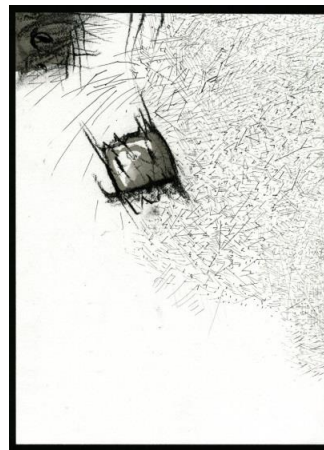
Harald Naegeli Ohne Titel, 6. Juli 2017 Tusche, Kohle über Federzeichnung einer zerschnittenen „Urwolke“

Bildrechte: Harald Naegeli, © VG Bild-Kunst, Bonn 2017 Beide Bilder stammen aus der Graphischen Sammlung, Museum Universität Tübingen, Stiftung des Künstlers 2017