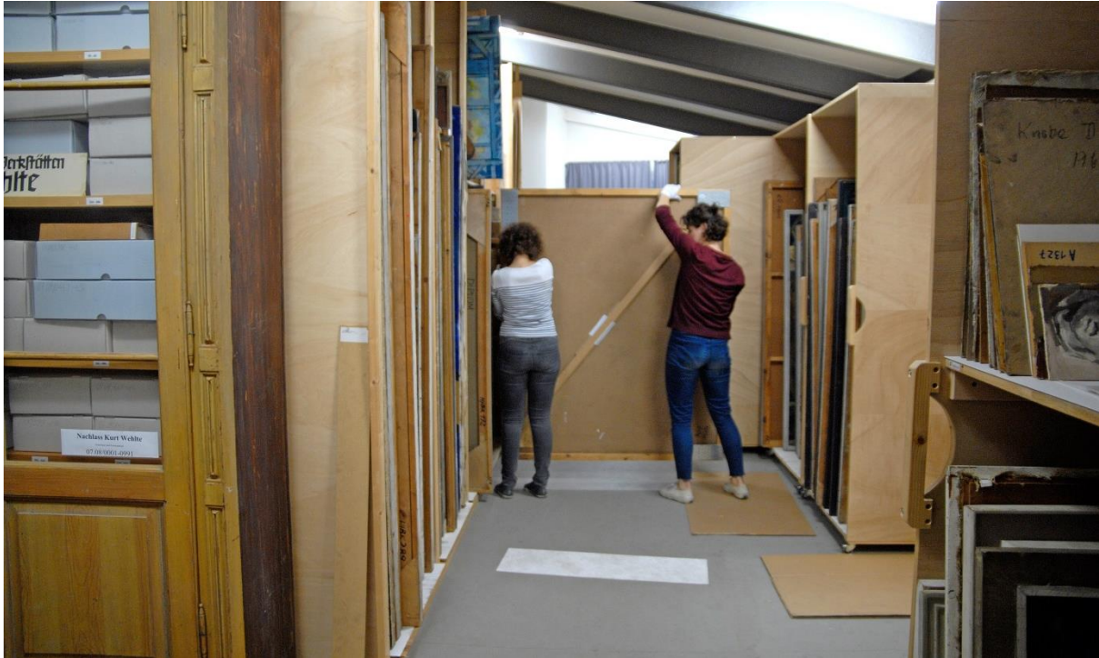
Arbeitssituation während der Sommerschule an der HfBK Dresden 2017

Für alle Beteiligten einer Erfassungskampagne ist eine detaillierte und konzentrierte Vorbereitung der geplanten Arbeitsschritte wichtig.