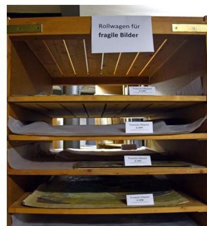
Links: Säuberung der Gefache; Mitte: Zuschnitt der Pappen; Rechts: Liegende Lagerung für besonders fragile Bilder

Im Vorfeld gilt es auch zu überlegen, wie mit besonders beschädigten Objekten umzugehen ist. Eine sogenannte erste Notsicherung – wie sie etwa im Falle loser