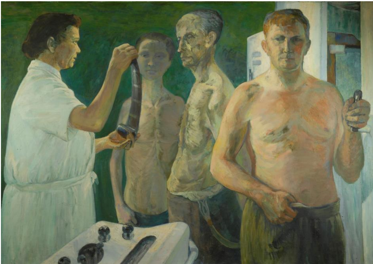
Ingrid Zietlow: Volksröntgenaktion, 1959, Öl auf Leinwand, HfBK Dresden / Kustodie, Inv.-Nr. A 0125, Rechte: Bettina Vardanjan

© 2018 / ARBEITSGRUPPE BMBF-PROJEKT „KÖRPER UND MALEREI“ DER HOCHSCHULE FÜR BILDENDE KÜNSTE DRESDEN