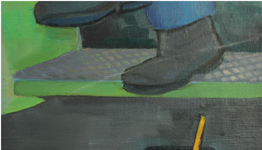
Kratzer auf einem Gemälde durch falsche Lagerung

Datenbank aufgenommen wurden. Stichproben zeigten jedoch, dass die damalige Übertragung der Daten an vielen Stellen fehler- und lückenhaft erfolgt war. Auch stimmten die Standorte in der Datenbank nicht immer mit den aktuellen überein, und es wurde ersichtlich, dass sich in dem Gesamtkonvolut eine große Anzahl von Gemälden befand, die nirgends verzeichnet waren. Wichtige Zusatzinformationen, wie etwa die Provenienz, sowie fotografische Aufnahmen der Gemälde waren in der Datenbank nur vereinzelt vorhanden.