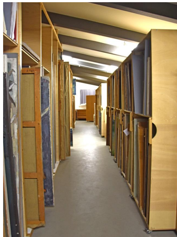
Gemäledepot HfBK Dresden, Ansicht vor und nach der Bestands- und Zustandserfassung