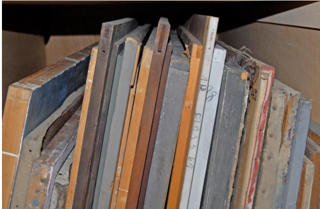
Gemälde depot HfBK Dresden, Lagerungsbedingungen vor und nach der Bearbeitung

Im Gebäude Brühlsche Terrasse der HfBK Dresden lagern in einem alarmgesicherten, unklimateierten Raum von rund 170 m 2 über 1.500 Gemälde. Sie stammen überwiegend aus der Zeit der DDR, darunter viele Studien- und Diplomarbeiten, aber auch Schenkungen von emeritierten Professoren gehören zum Bestand.