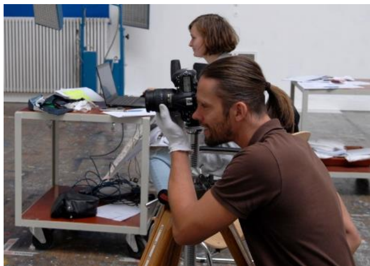
Aufmaß und fotografische Erfassung der Gemälde