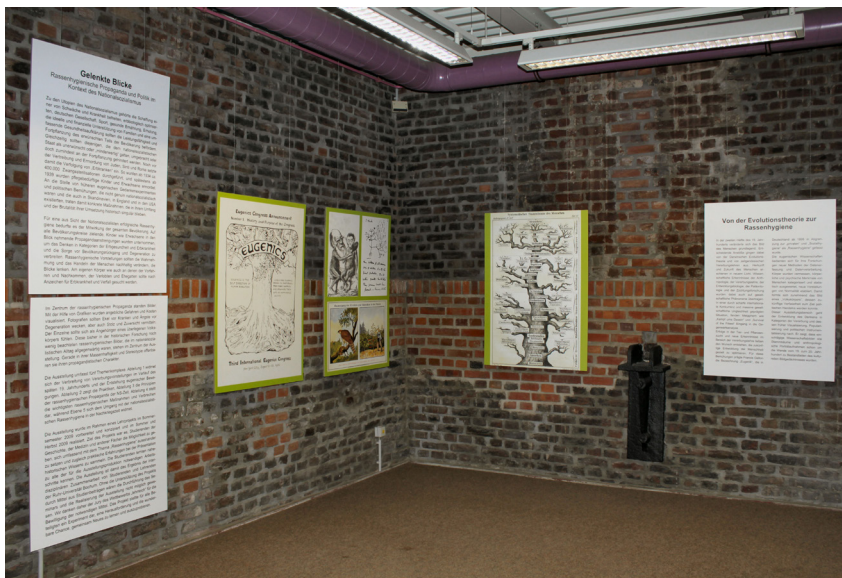
Foto aus dem studentischen Ausstellungsprojekt „PER“ (Ausstellung Gelenkte Blicke“)

Zu sehen ist die Abteilung „Von der Evolutionstheorie zur Rassenhygiene“.