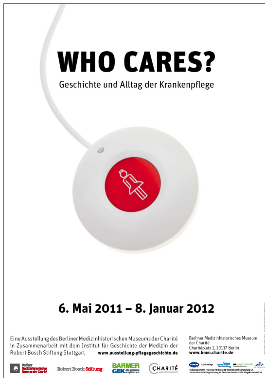
Ausstellungsplakat der Ausstellung "WHO CARES? Geschichte und Alltag der Krankenpflege"