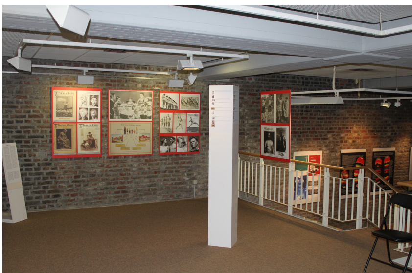
Foto aus dem studentischen Ausstellungsprojekt „PER“ (Ausstellung Gelenkte Blicke“)