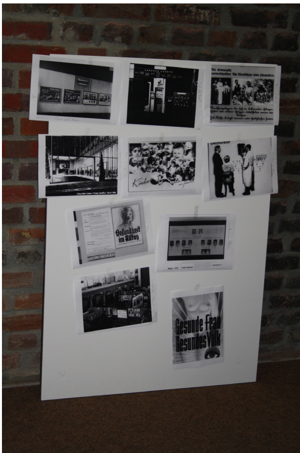
Foto aus dem studentischen Ausstellungsprojekt „PER“ (Ausstellung „Gelenkte Blicke“)

Entwurf einer Ausstellungstafel in der Seminarphase