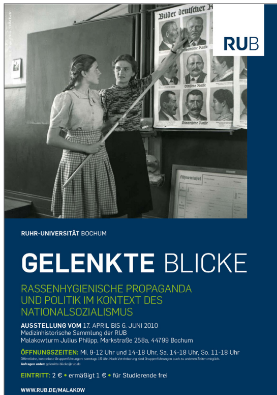
Ausstellungsplakat der Ausstellung „Gelenkte Blicke“