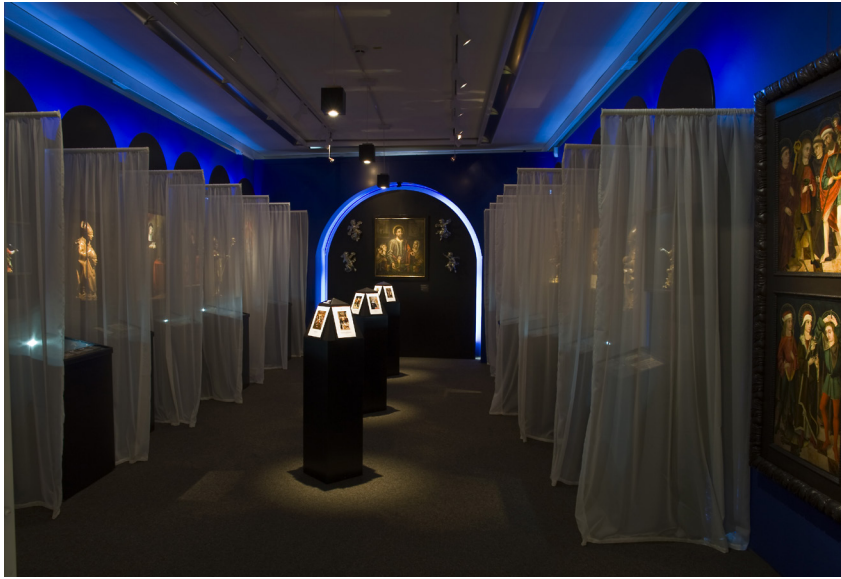
Ausstellung „Heilige und Heilkunst“ im Deutschen Medizinhistorischen Museum, Ingolstadt, Ausstellungsansicht