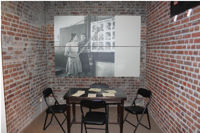
Foto aus dem studentischen Ausstellungsprojekt „PER“ (Ausstellung „Gelenkte Blicke“)